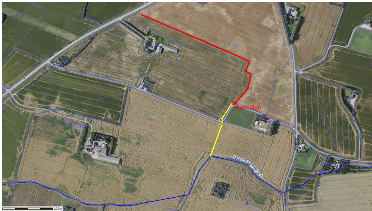
Figur 3. Nuværende situation. på figuren ses åben strækning (rød) og rørlagt strækning (gul).

Grøften er 30 cm i bundbredde og ender i rør på 200 mm, som er rørlagt ca. 230 meter inden udløb i Trædholm Bæk, som er naturbeskyttet, Målsat og i dårlig økologisk tilstand. Grøften er periodisk vandførende indeholder ikke vandløbstypiske planter og dyr