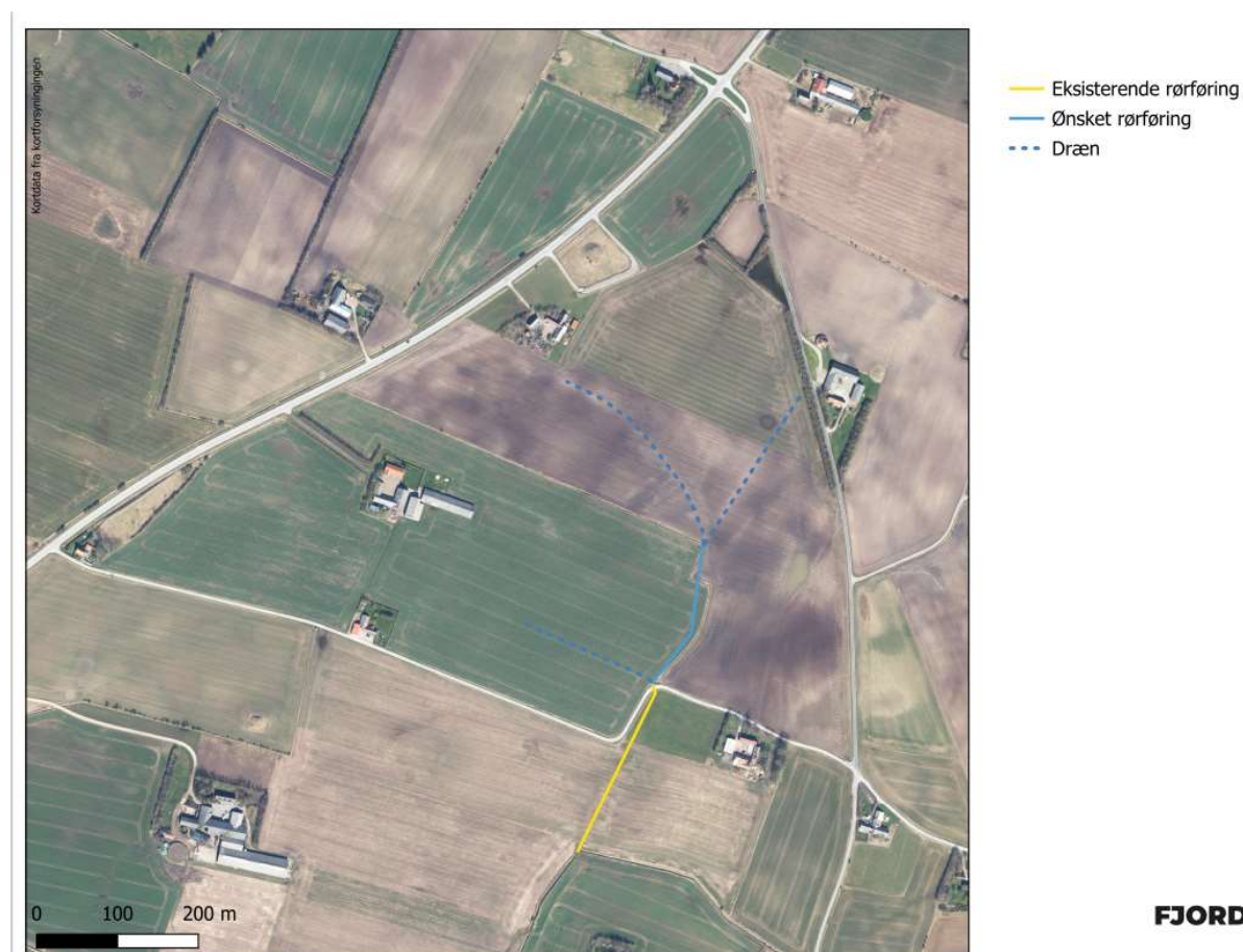
Figur 1. Oversigtskort fra ansøgning